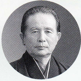
四日市市文化協会理事長