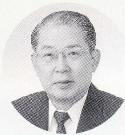
四日市市長 井上 哲夫

第53回四日市市民文化祭が四日市市文化協会の皆様のご努力により、5月から来年3月まで約1年間にわたって、盛大に開催されますことは、まことに喜ばしいことでもあります。