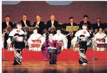
オープニング・フェスティバル

A 文化協会はみんなで文化をサポートしたり、創りあげる活動をする仲間たちの集まりです。具体的な指導はできませんが、丁寧にアドバイスをいたします。