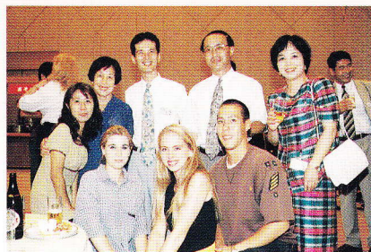
国際交流のひとつま