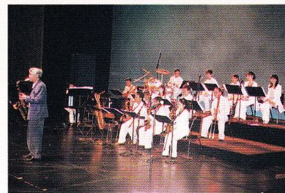
ロングビーチのステージ